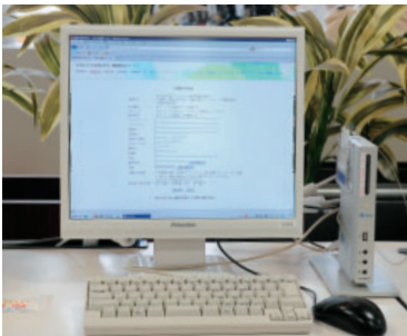
統合認証システムの強化により、ログインさえすれば、あらゆるITシステムに容易にアクセスができる。 (写真は図書館システムの本の貸し出し状況)

今回の更改は、利便性向上だけでなく、統合認証システムを強化する側面もある。「昨今は、いろいろなWEBのITシステムが学内に導入されており、それぞれへアクセスするたびに別個の認証を得るのはとても面倒です。従来システムでは、ユーザ名とパスワードが共通化されていたのですが、今回はシングルサインオンを導入、どこかで一度認証されたら他のITシステムへ入れるよう