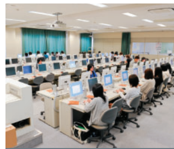
演習室での使用イメージ。120人収容の大演習室で全員が同時に端末を起動しても1分以内で立ち上がる。

通常のPCでも立ち上げからログインして動かせるようになるまで2分程度は掛かる。それをシンクライアントで擬似的に1分で終わらせるように、1秒間に100件を処理できるレスポンスでITシステムを設計した。そして、多くの人が同時に使っても動くかどうかを試すために、学生の協力を得て試験を繰り返した。「ツールを使ったテストもできませんが、実際に人間が試してみるとなぜか認証からこぼれてしまうマシンが出てくるのです。そこを何とかするのが最後のチューニングポイントでした。おかげさまで、最初の授業で100人が同時に端末を起動しても問題なく稼働しました」と江藤様。