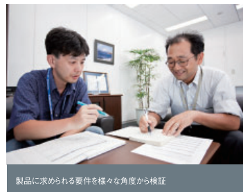
製品に求められる要件を様々な角度から検証

れの得意分野を持ち寄って1つのシステムを作り上げることで、ハードウェア製造から保守まで一貫して提供できるサービスを実現。「高集積」、「エネルギー効率」、「保守サポート切れからの解放」という3つの課題をクリアすることに挑戦した。