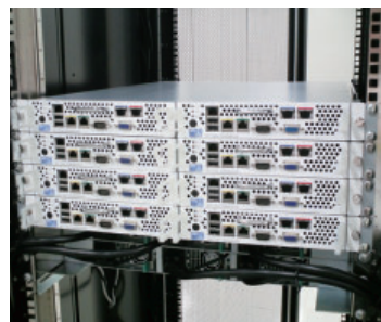
直流給電方式の採用によって、安全かつ高効率な直流給電を実現しながら、従来の交流給電に比べ、システム全体の電力効率を10%以上改善することも可能となった。

安全かつ高効率な直流給電を実現しながら、従来の交流給電に比べシステム全体の電力効率を10%以上改善することも可能となった。