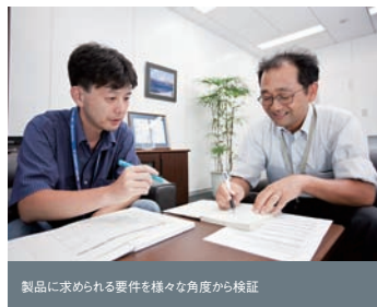
製品に求められる要件を様々な角度から検証

れの得意分野を持ち寄って1つのシステムを作り上げることで、ハードウェア製造から保守まで一貫して提供できるサービスを実現。「高集積」、「エネルギー効率」、「保守サポート切れからの解放」という3つの課題をクリアすることに挑戦した。